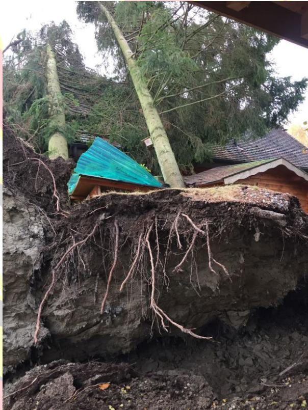
Intervention « Eléments naturels du 12.11.2017

• La deuxième phase sera évidemment dédiée à l'ensemble de la population et sera naturellement aussi orientée vers les familles. Nous nous réjouissons d'ores et déjà d'accueillir les amis des sapeurs-pompiers et je remercie toutes les personnes qui vont travailler à l'organisation de cette très belle journée qui s'annonce remplie de surprises.