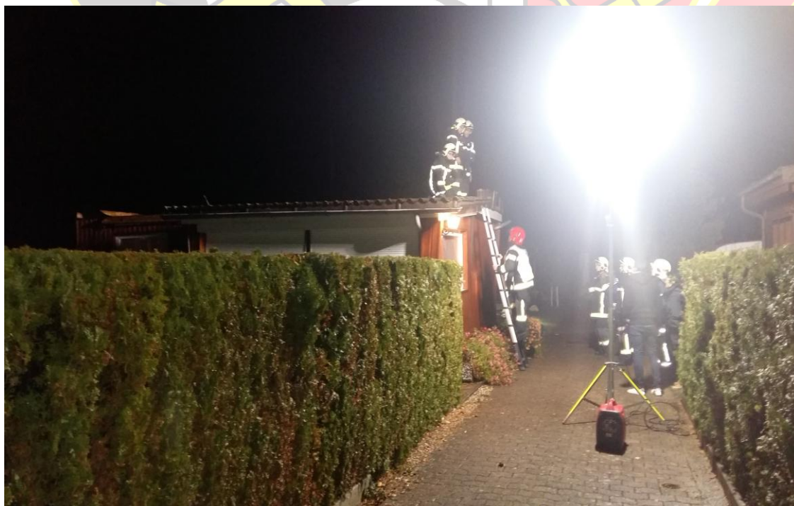
Intervention pour « Eléments naturels » le 12.11.2017

Beaucoup de sacrifices ont été faits aux dépens de la vie professionnelle et, surtout, de la vie privée des sapeurs, pour la formation, l'entretien du matériel, la gestion du CSP et les interventions. Pour tous ces sacrifices, je tiens personnellement à remercier chaque sapeur ainsi que sa famille et son employeur.