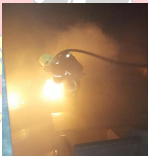
Exercice à la Rama (Cugy VD) du 22.04.2017

Les commandants du groupement Estavayer et environs se sont rencontrés 3 fois afin d'organiser, planifier et donner les lignes directrices pour les corps régionaux.