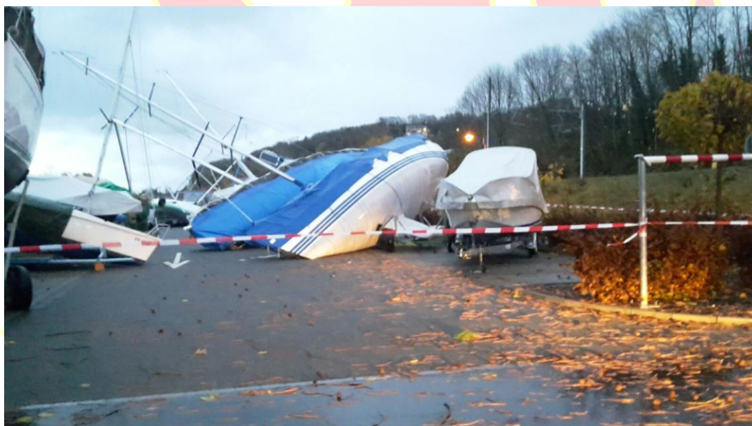
Intervention « Eléments naturels » du 12.11.2017