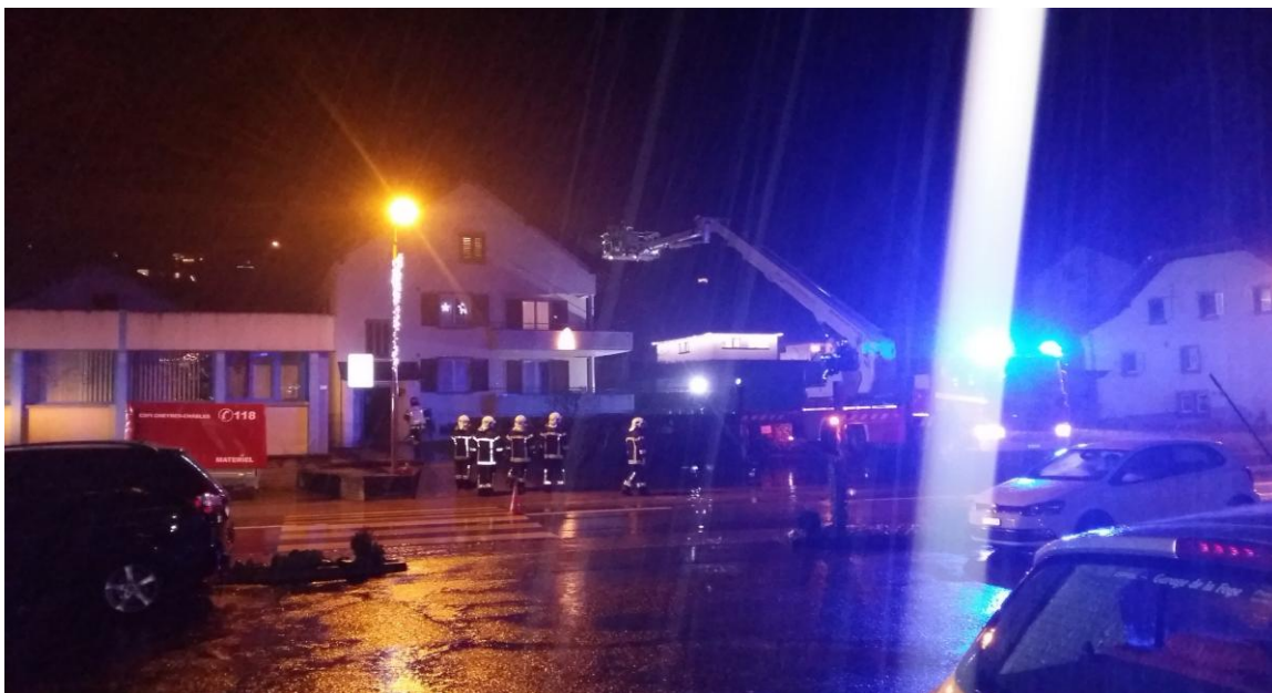
Intervention Elément naturels du 14.12.2017