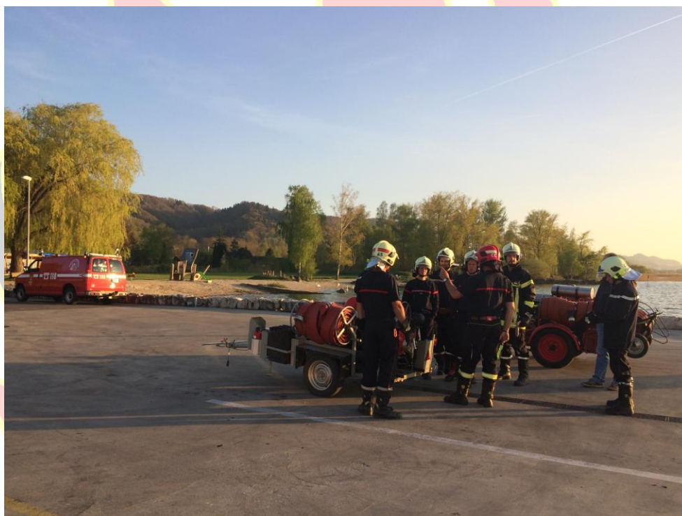
Exercice du 12.04.2017