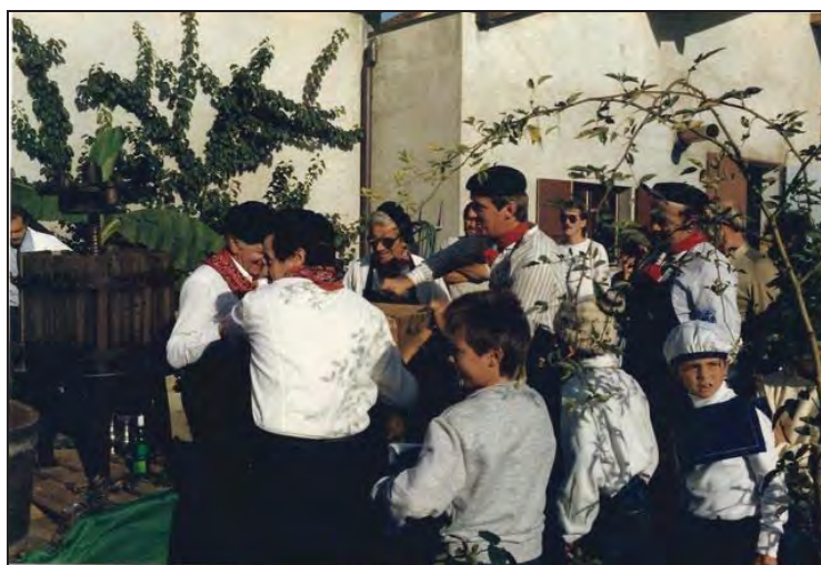
Pressurée, en couleurs, une génération plus tard...