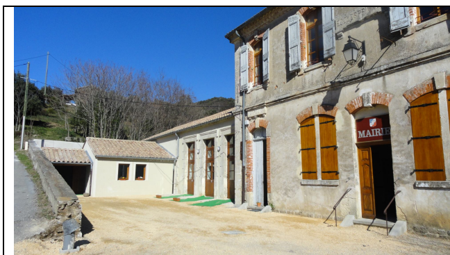
D'un extérieur vétuste, l'annexe de la mairie

A la veille d'élections à St-Martial, avec l'installation bientôt d'une nouvelle équipe municipale, j'ose espérer que nos contacts vont perdurer et que nous trouverons ensemble le sens qui fait qu'un jumelage, c'est d'abord la rencontre des cœurs et des émotions.