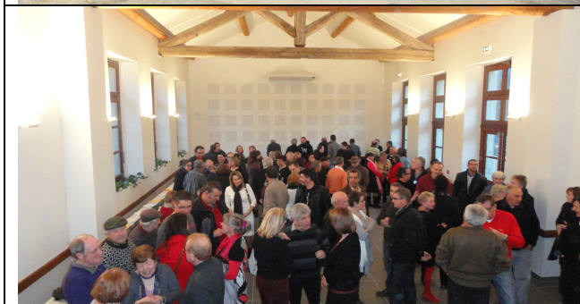
laisse apparaître un nouvel intérieur convivial et chaleureux