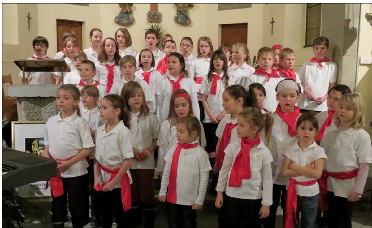
Ici lors du concert de Noël 2012.

Le spectacle des P'tits Bouchons aura lieu à la Grande Salle de Châbles, les 3, 4 et 5 mai 2013.