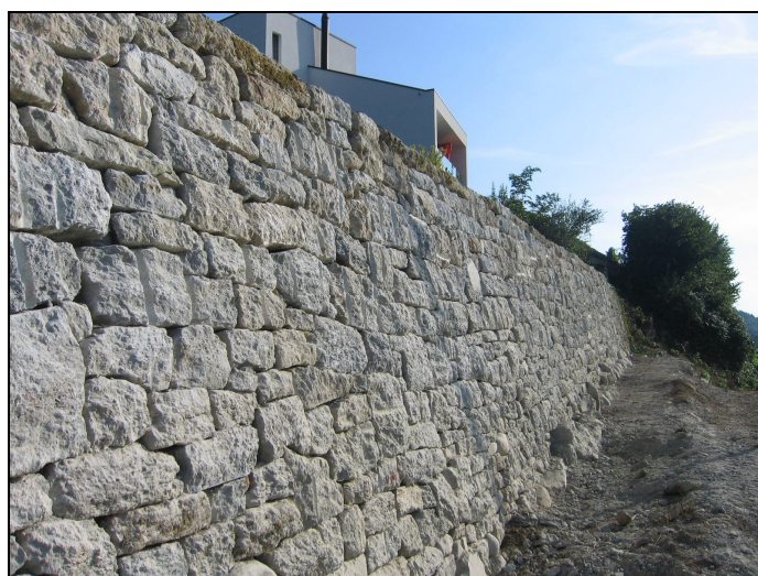
Extrait adapté de la Revue du Fonds suisse pour le Paysage

de notre patrimoine ». Et à tous ceux qui ont permis à la commune de Cheyres de rénover les murs de ses vignes, il ne dit pas seulement merci mais « Merci et santé! ». A votre bonne santé, avec à la main, bien entendu, un verre de vin du pays auquel les murs de pierres sèches restaurés accordent une saveur particulière : « Si l'on se donne la peine, en dégustant nos crus, de jeter un regard sur nos vignes cernées de murs de pierres sèches, cela apporte une saveur supplémentaire au résultat du travail de nos vignerons ».